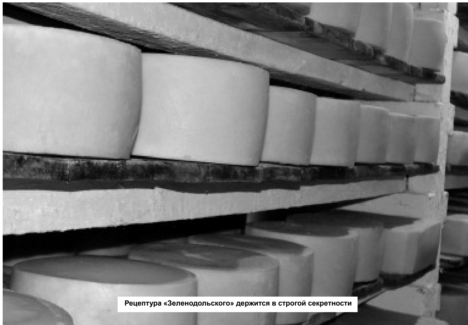
Рецептура «Зеленодольского» держится в строгой секретности

Многие производители для удешевления продукции добавляют в сыры "пальмовое" масло. На это наше замечание, сыродельцы округлили глаза и сказали, что не знают, как оно выглядит. Верим без сомнений.