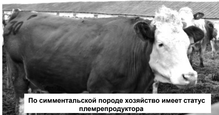
По симментальской породе хозяйство имеет статус племрепродуктора

ООО "АКХ "Ануйское" - крупнейшее сельхозпредприятие в Алтайском крае, базируется в 9 селах Петропавловского района. Занимается растениеводством, животноводством, переработкой сельскохозяйственной продукции.